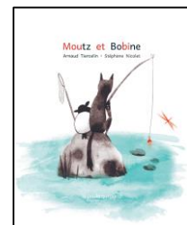
Moutz et Bobine A. Tiercelin – S. Nicolet ed. La Poule qui Pond - 2018

L'opération, encouragée par l'Académie française, se déroule dans le cadre des clubs Coup de Pouce Clé (Clubs de lecture-écriture), un programme de prévention de l'échec scolaire précoce mis en place depuis 25 ans dans plus de 200 villes de métropole et d'outre-mer, avec l'appui et l'expertise de l'Association Coup de Pouce et en collaboration avec l'Éducation nationale.