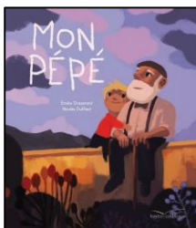
Mon Pépé E. Chazerand – N. Duffaut ed. Gautier.Languereau - 2018