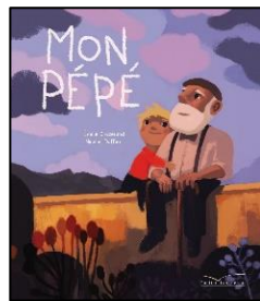
Mon Pépé E. Chazerand – N. Duffaut ed. Gautier.Languereau - 2018