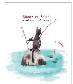
Moutz et Bobine A. Tiercelin – S. Nicolet ed. La Poule qui Pond - 2018

Le trophée du PCPPL 2020 sera remis à l'auteur.e et à l'illustrateur.trice du livre lauréat lors d'une cérémonie nationale qui aura lieu début juin.